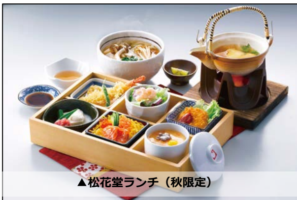
▲松花堂ランチ（秋限定）