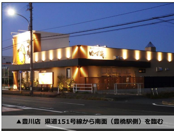
▲豊川店 県道151号線から南面（豊橋駅側）を臨む