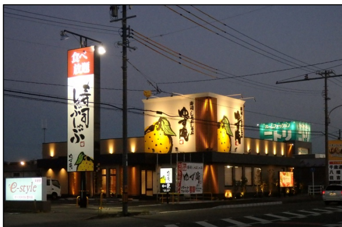
▲豊川店 県道151号線から北面（豊川側側）を臨む

株式会社物語コーポレーション（本社：愛知県豊橋市/代表取締役社長・COO：加治幸夫）は、2015年12月7日（月）11:30、豊川店初出店となる「寿司・しゃぶしゃぶ ゆず庵 豊川店」を2店舗同時オープンしました。豊川店のオープンで「寿司・しゃぶしゃぶ ゆず庵」は、全国で20店舗となりました。