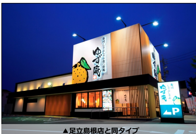
▲足立島根店と同タイプ

株式会社物語コーポレーション（本社：愛知県豊橋市/代表取締役社長・COO：加治幸夫）は、2015年12月14日（月）11:30、23区内に初出店となる「寿司・しゃぶしゃぶ ゆず庵 足立島根店」をオープンしました。足立島根店のオープンで「寿司・しゃぶしゃぶ ゆず庵」は、全国で21店舗となりました。