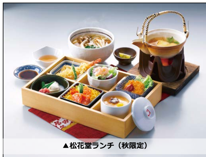
▲松花堂ランチ（秋限定）