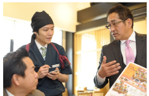
▲積極的に現場の意見を取り入れる

経営理念「Smile&Sexy」とは、「自らを磨き自立することで、自ら意思決定ができる人間を目指そう」という想いが込められており、この実践こそ、当社の強みである「人財力」の源泉であり、激しい環境変化に対応し、勝ち抜くための底力であると考えています。