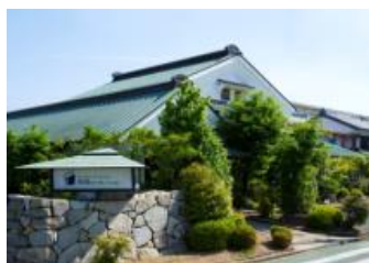
▲豊橋フォーラムオフィス