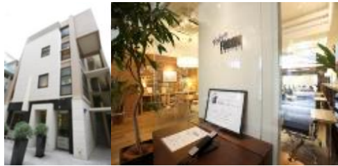
▲東京フォーラムオフィス