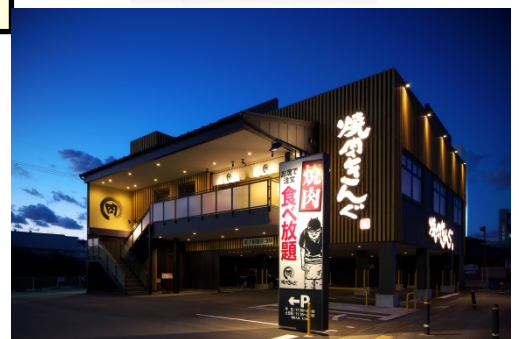
▲郊外大型焼肉店の焼肉きんぐ

外食産業記者会は、平成16年（2004年）の創立25周年を機に記念事業として、表彰制度を創設しました。目的は「外食産業の発展と外食の食文化醸成に寄与する」ことにあります。加盟社の登録記者すべてが参加し、「外食産業界でその年に活躍した人、話題になった人」を毎年選び、それぞれ紙（誌）面を通じて受賞者を報道し、後日、栄えある表彰式を行います。