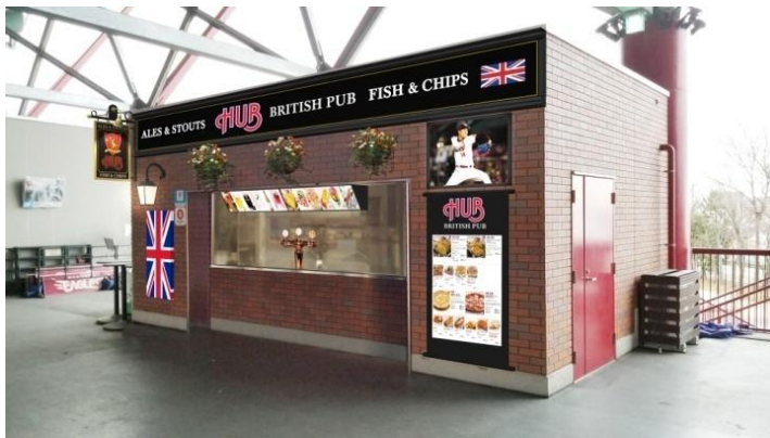
※店舗写真はイメージです

4月2日(火)、プロ野球チーム「東北楽天ゴールデンイーグルス」のホームスタジアムである楽天生命パーク宮城内にも売店施設がオープンします!